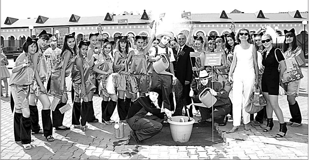
Мы все вместе поливали ростки будущего дерева-памятника.